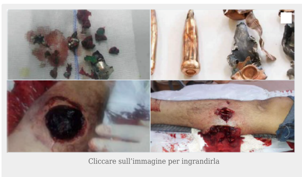
Figura 2. Munizioni e lesioni

Oltre ai numeri, tuttavia, sta emergendo un aspetto nuovo e inquietante: il tipo delle ferite. Il gruppo palestinese per i diritti umani Al-Haq dichiara[5] di avere documentato, durante gli incidenti a Gaza, lesioni che indicano come le forze israeliane abbiano “deliberatamente preso di mira parti specifiche del corpo dei manifestanti, causando la morte o danni gravi e permanenti”. Oltre il 60% delle ferite interessa gli arti inferiori ( Figura 2 ). Il 30 marzo 2018 il numero di ricoveri ospedalieri con lesioni alle gambe è stato 50 volte superiore a quello dei morti.[6] Secondo il direttore del dipartimento di emergenza del più grande ospedale di Gaza, al-Shifa,[7] la maggior parte delle vittime sono state “colpite, per lo più agli arti inferiori, da munizioni vere che hanno maciullato ossa e tagliato vene, nervi e muscoli.”